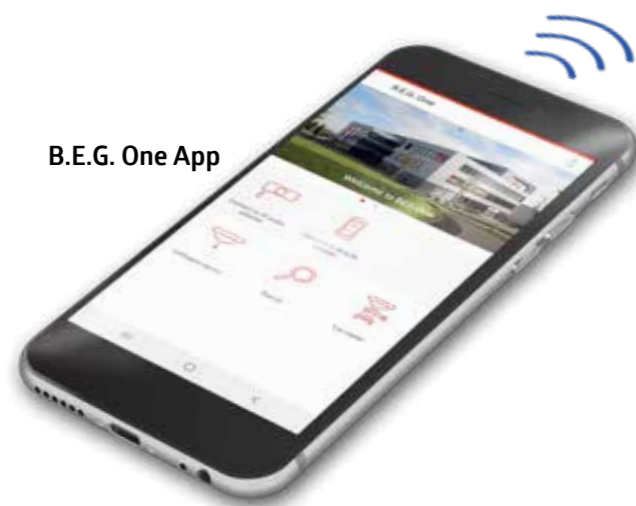
B.E.G. One App

Téléchargez l'application de contrôle à distance gratuitement !