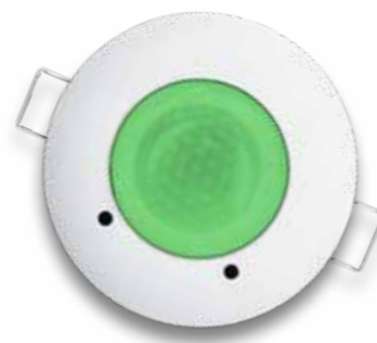
Bonne qualité de l'air

L'appareil offre également la possibilité de signaler le dépassement de la valeur limite au moyen d'un signal sonore et d'un contact de relais.